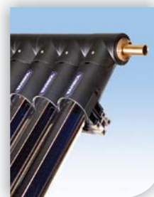
3. Kliknúť do pozície