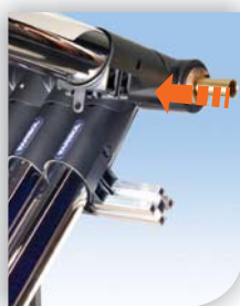
1. Vsunúť Varisol trubicu